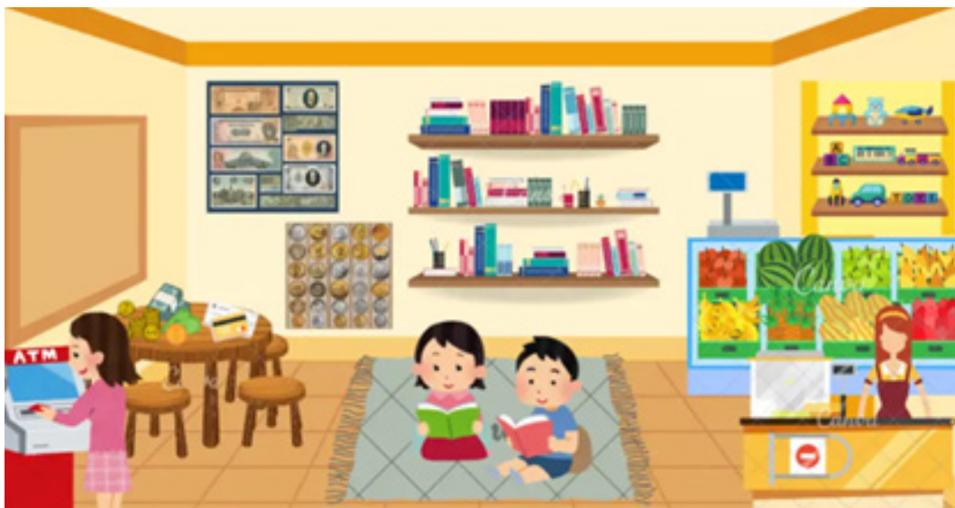
Рис. 1. Макет предметно-ігрового розвивального середовища (осередок економіки)

Під час вивчення навчальної дисципліни здобувачі вищої освіти набувають практичних умінь у доборі, конструюванні та розробці інноваційних методів формування основ фінансово-економічної грамотності дошкільників. Розглянемо приклади практичних завдань, у процесі виконання яких здобувачі вищої освіти набувають означені знання, уміння та навички. Так, у процесі ознайомлення з темою «Засоби формування основ фінансово-економічної грамотності» студенти за допомогою застосування «Canva» створюють макет предметно-ігрового розвивального середовища, зокрема осередок з економічного виховання (рис. 1), добирають науково-популярну, художню літературу для