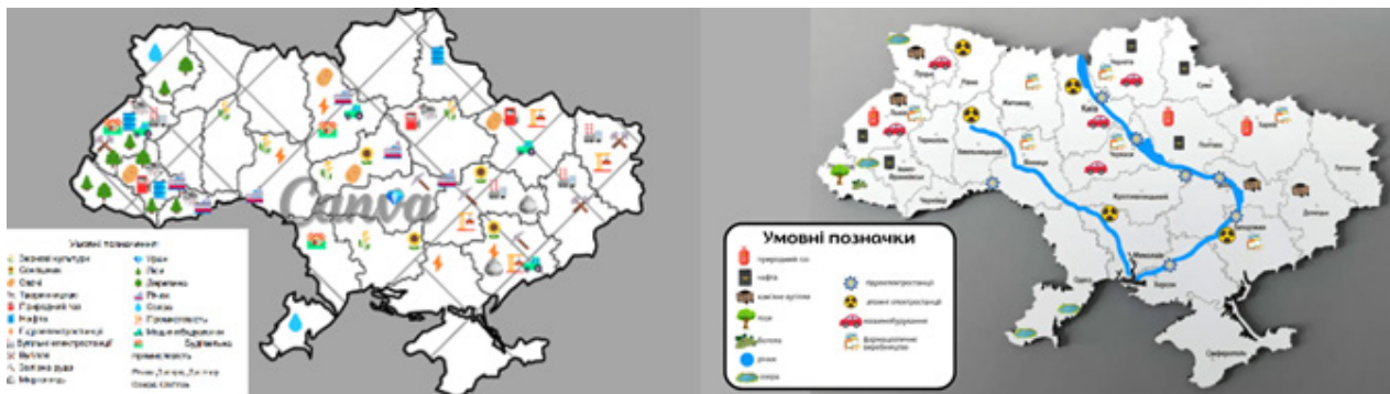
Рис. 3. Інтерактивна карта «Економічні ресурси України»

які використали студенти, є доступними для дітей дошкільного віку. До даної карти здобувачі вищої освіти розробили супровідну бесіду для дітей старшого дошкільного віку.