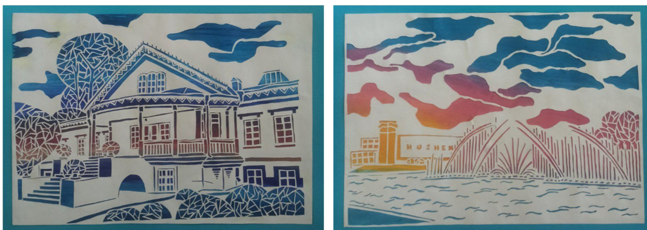
Рис. 2. Зразки творчих робіт проекту «Книга-витинанка «Серце Вінниці»»

«Серце України». Основна ідея проекту – познайомити здобувачів з техніками мистецтва витинанки, сформувані у них практичні навички сучасного оформлення творчої роботи, дати можливість отримати практичний досвід роботи над груповим проектом. Історичні будівлі та місця м. Вінниці стали образами унікальних авторських витинанок, зміст яких влучно доповнювали авторські вірші здобувачів (рис.2).