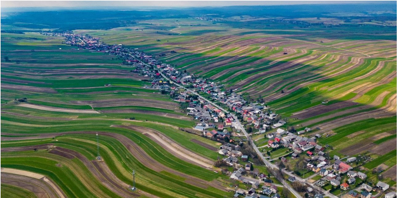
Рис. 3. Придорожнє село Сулошова у Польщі

на задалегідь вибраному оригінальному у природньому відношенні місці будувати українське село з усіма його національними ознаками; другий – провести реконструкцію, оригінального за ландшафтною структурою