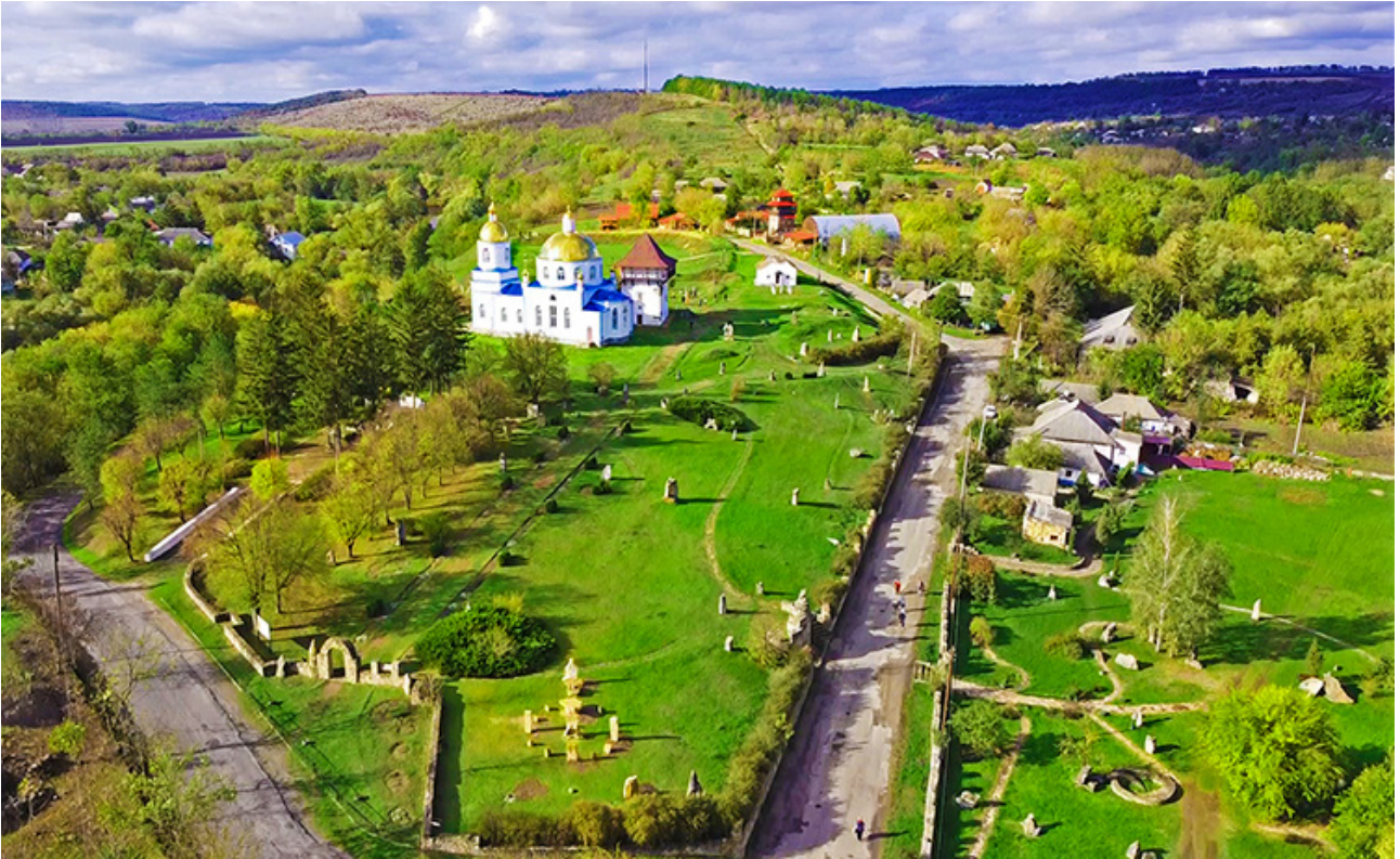
Рис. 4. Музей-село Буша у Вінницькій області

не, естетичне тощо значення для цього села. Серед них можуть бути церкви, стародавні городища й вали, млини на річках, «стінки» з геологічними відслоненнями, різноманітні пам'ятки, просто стародавні садиби. Як наслідок, у межах села поступово формується своя система заповідних урочищ, що допоможе оптимізувати сучасні, часто занедбані сільські ландшафти. Ці заповідні урочища-«куточки» можуть також бути тематичними й, наприклад, повністю відтворити історію села у різні періоди його розвитку.