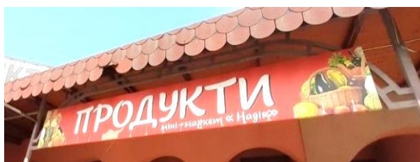
Фото 9. Написи українською мовою в крамниці «Надія» (Солотвино)

На відміну від угорської меншини румуни не становлять більшості в жодному місті, однак, як ми зазначали вище, в ході децентралізації в одній ОТГ вони становлять 86,7 % населення. Центром цієї громади є Солотвино. Це селище відоме своєю соляною шахтою та соленими озерами, стало привабливим туристичним об'єктом. У населеному пункті, поруч із румунськомовним населенням, проживає й численна угорська меншина. У Солотвині діє чимало більших і менших продуктових крамничок та кілька супермаркетів, проте для них не притаманні написи румунською або угорською мовами (див. Фото 9–10).