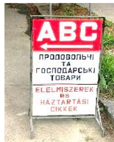
Фото 3. Берегове