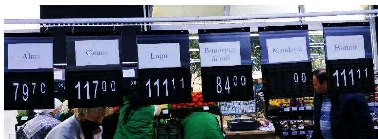
Фото 8. Перелік фруктів в «Амбарі» (Берегове) кількома мовами

У Берегові функціонує один місцевий супермаркет, який отримав назву « Piramis » («Піраміда»). У його написах та рекламах часто з'являється угорська мова, власником закладу є угорець за національністю.