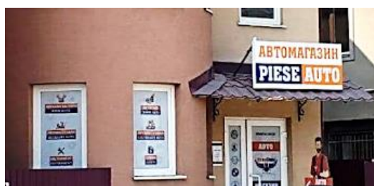
Фото 16. Українсько-румунський напис у Нижній Апші

У Закарпатській області діють аптеки як загальноукраїнських та регіональних мереж, так і місцевих підприємців. У центрі Берегова розміщена аптека однієї з найбільших українських мереж. Як бачимо на фото 17, на фасаді закладу подано назву аптеки угорською та українською мовами. Цікаво, що поряд з угорським та українським написом розміщено й англійське слово « beauty », тобто « краса ». Більшість написів і вивісок всередині аптеки теж подають двома мовами: угорською та українською.