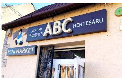
Фото 1. Косонь

На одному з українських новинарних сайтів з'явилася публікація 10 про те, що туристи, які приїжджають із внутрішніх областей України, часто дивуються, що по всьому Закарпаттю трапляються продуктові крамнички з написами «АВС». Для місцевого мешканця чи туриста з Угорщини це цілком природне явище, тож вони однозначно можуть декодувати це послання: у магазині можна знайти всі важливі продуктові та господарські товари. Автор статті розкриває причини такого явища: у 90-х роках, коли панувала епоха бартеру та дефіциту, багато людей їздили до Угорщини й привозили звідти товари, яких тоді не можна було придбати в Україні. Назва «АВС» 11 прийшла в закарпатські угорські села з Угорщини. Але на відміну від угорських магазинів АВС наші крамниці не із самообслуговуванням, 12 покупців обслуговує продавець. Магазини під назвою «АВС» не є мережею, це самостійні більші-менші крамнички, власниками яких зазвичай є місцеві підприємці, проте для всіх характерним є те, що назва «АВС» написана латинськими літерами, а до неї часто подається додатковий текст українською та угорською мовами (див. Фото 1–5).