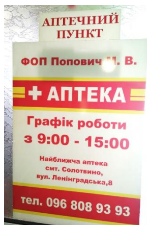
Фото 21. Вівіска українською мовою на одній з аптек Солотвина