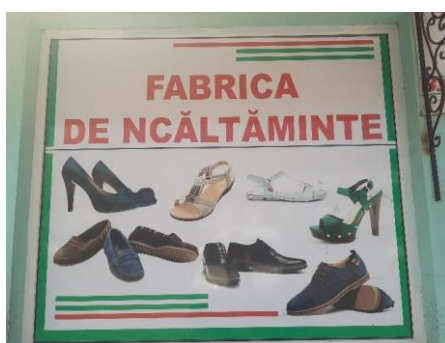
Фото 13. Магазин взуття з вивіскою румунською мовою (Солотвино)

Після проголошення незалежності України, паралельно з автомобілями радянського виробництва («Лада», «Москвич», «Запорожець», «Волга»), на дорогах усе частіше почали з'являтися іномарки (наприклад, «Ауді», «Фольксваген», «Мерседес» тощо). Якщо раніше автомобіль був предметом розкоші, то зараз нерідко в одній родині експлуатується кілька автомобілів. Через це по всьому Закарпаттю почали відкриватися магазини автозапчастин. На фасаді більшості таких крамниць в угорських населених пунктах бачимо двомовні українсько-угорські вивіски (див. Фото 14–15). Так само в магазинах автозапчастин,