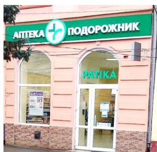
Фото 18. Українська вивіска закладу загальноукраїнської аптечної мережі, під нею напис угорською мовою «PATIKA»

На фасаді однієї з аптек села Вари (входить до Берегівської ОТГ) бачимо українсько-угорський напис (фото 19). Розміщені біля входу повідомлення також двомовні (див. Фото 20). У текстах цих інформаційних повідомлень допущено кілька помилок. У Берегівській ОТГ в рекламних текстах, вивісках нерідко трапляються описки та помилки саме з вини виробника цих рекламних матеріалів [25, с. 173], тож, можливо, що тут помилку також допустило рекламне агентство.