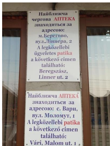
Фото 20. Повідомлення двома (українською та угорською) мовами біля входу в аптеку

Вивіски на аптеках у населених пунктах, де проживають румуни, переважно подають українською мовою (див. Фото 21). Тільки в одному випадку ми зустріли таку вивіску, де поруч з українською мовою використано і румунську, але зі значно меншим розміром літер (див. Фото 22).