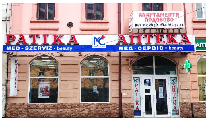
Фото 17. Двомовна вивіска загальноукраїнської аптечної мережі в Берегові

У Закарпатській області діють аптеки як загальноукраїнських та регіональних мереж, так і місцевих підприємців. У центрі Берегова розміщена аптека однієї з найбільших українських мереж. Як бачимо на фото 17, на фасаді закладу подано назву аптеки угорською та українською мовами. Цікаво, що поряд з угорським та українським написом розміщено й англійське слово « beauty », тобто « краса ». Більшість написів і вивісок всередині аптеки теж подають двома мовами: угорською та українською.