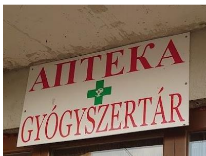
Фото 19. Українсько-угорська вивіска однієї аптеки в селі Вари

На фасаді однієї з аптек села Вари (входить до Берегівської ОТГ) бачимо українсько-угорський напис (фото 19). Розміщені біля входу повідомлення також двомовні (див. Фото 20). У текстах цих інформаційних повідомлень допущено кілька помилок. У Берегівській ОТГ в рекламних текстах, вивісках нерідко трапляються описки та помилки саме з вини виробника цих рекламних матеріалів [25, с. 173], тож, можливо, що тут помилку також допустило рекламне агентство.