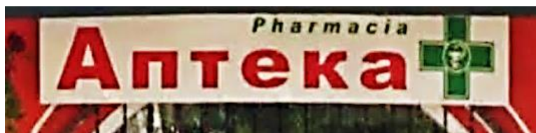
Фото 22. Вівіска українською та румунською мовами на одній з аптек Солотвина

Висновки дослідження та перспективи подальших наукових розвідок. У статті було проаналізовано мовний ландшафт закладів торгівлі в закарпатських населених пунктах з угорським та румунським населенням. Оскільки угорська нацменшина в регіоні є численною, то багатомовні написи і вівіски в населених пунктах, де проживають угорці, зокрема й у мовному ландшафті економічної сфери, трапляються досить часто. Натомість у населених пунктах, де проживають румуни, написи і вівіски румунською мовою на комерційних закладах трапляються вкрай рідко. У візуальному мововживанні Солотвинської ОТГ, де більшість мешканців становлять румуни, домінує українська мова.