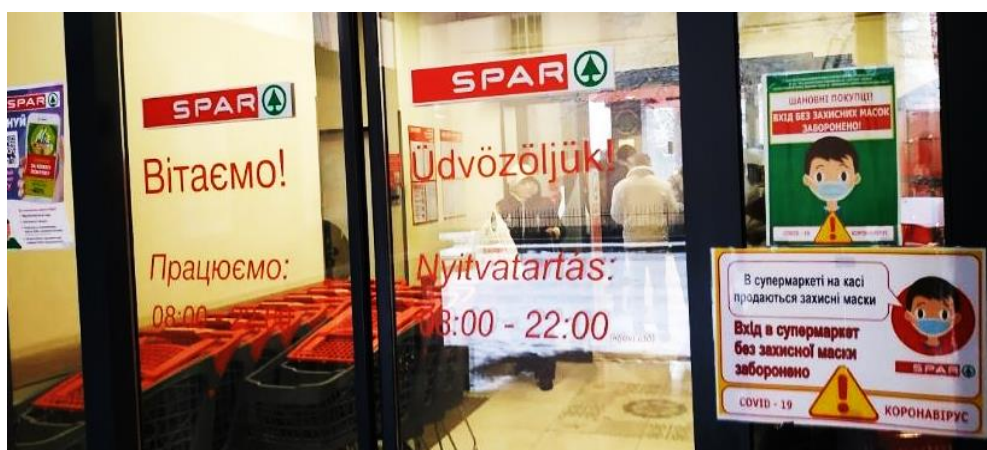
Фото 7. Вхід до торговельного центру «Spar» у Берегові

«Амбар» – це закарпатська торговельна мережа супермаркетів, заснована ще 1997 року. Однак у Берегові перший такий заклад відкрився тільки 2019 року. Магазини мережі часто розміщуються навіть у відносно невеликих селах, але переважно в українських, натомість в угорських селах такі випадки поодинокі (наприклад, у Великій Доброні та Вишкові). У магазині, розміщеному в Берегові, переважно розміщують написи українською мовою, але трапляються написи угорською. На фото 8 бачимо, що перелік фруктів у супермаркеті надрукований на звичайному аркуші білого паперу формату А4: назви певних фруктів указані тільки угорською, інших – тільки українською. У тексті угорською мовою відсутні надрядкові знаки. Цікаво, що фрукт «lime» (лайм) працівники записали орфографічно неправильно, орієнтуючись за звучанням – «lajm».