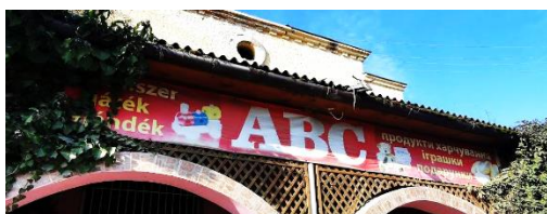
Фото 4. Мужієво