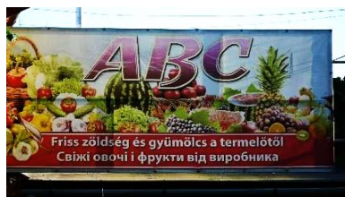
Фото 5. Берегове

В Україні дуже довго не діяли великі торговельні мережі, податкова система не сприяла таким формам бізнесу, але після змін у податковому законодавстві до країни почали заходити міжнародні мережі, а також відкриватися регіональні та загальноукраїнські мережі закладів.