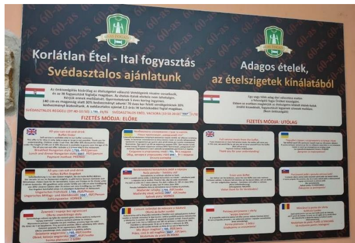
Фото 30. В ідальні, що розташована на одному з автобанів Угорщини, на вході, крім угорської мови, інформація дублюється ще шістьма мовами (англійською, німецькою, польською, українською, словацькою та румунською)

Прагнення до одномовності в економічній сфері може призвести до системи закритого ринку, унаслідок чого може сформуватися не тільки звужений прошарок споживачів, але й самі підприємці ризикують втратити можливості міжнародного обміну досвідом. Існує потреба в новій, інноваційній стратегії, яка б базувалася на наднаціональній системі – для того, щоб закрити систему з допомогою багатомовності перетворити на відкриту систему, достатньо було б ринкового саморегулювання та допуску зовнішніх інспірацій. Аналіз досвіду мовної строкатості інших поліетнічних регіонів дозволяє зробити два важливі умовисновки і для Закарпатської області України. По-перше, «професійне управління, використання та маркетинг поліетнічності та багатомовності може сприяти покращенню добробуту всього суспільства», а по-друге, «колективний досвід життя меншини можна перетворити на економічні переваги» [11, с. 420]. На меншини Закарпаття та їхнє мововживання необхідно дивитися не як на гальмування суспільних процесів, а як на такий культурний капітал, який можна перетворити в економічний прибуток непрямыми чи прямими способами.