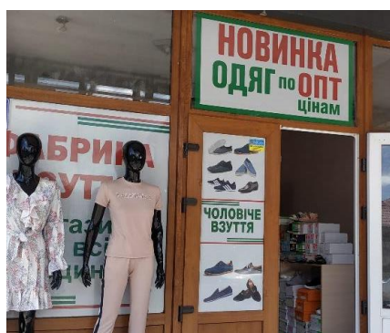
Фото 12. Магазин одягу та взуття з вивіскою українською мовою (Солотвино)

У Солотвині один підприємець, що реалізовує одяг та взуття, володіє двома крамницями. Якщо на вході першого магазину бачимо тільки напис українською мовою (див. Фото 12), то на фасаді другого вивіска є і румунською мовою (див. Фото 13).