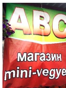
Фото 2. Вари