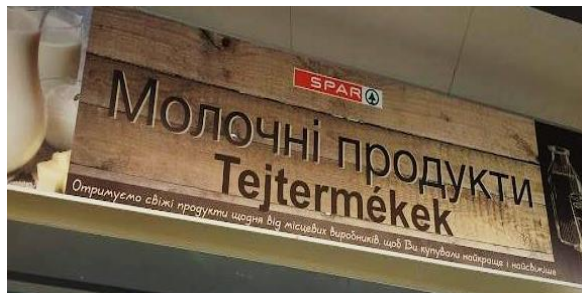
Фото 6. Інформацію про молочні продукти подають українською / угорською мовами, однак рекламний текст – тільки українською мовою

викликати довіру покупців до молочних товарів ( Ми щодня отримуємо свіжу продукцію від місцевих виробників, щоби Ви отримували найкраще і найсвіжіше ), також читаємо тільки українською мовою (див. Фото 6). Попри те, що йдеться про міжнародну компанію, англійською нема жодного повідомлення або інформаційної таблички. Графік роботи опублікований не так, як це вже стало місцевою традицією: – угорською за середньоевропейським часом, а українською – за київським [22; 23], натомість під угорським написом дрібними буквами зазначено, що йдеться про київський час (див. Фото 7).