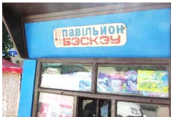
Фото 11. Продуктовий кіоск «БЭСКЭУ»

У випадку магазинів одягу ми спостерігаємо ту саму тенденцію, що й у продуктових крамницях – у населених пунктах, де проживають угорці, на вивісках, підлаштовуючись під мововживання покупців, з'являється угорська мова, натомість в румунських населених пунктах написи румунською мовою спостерігаються значно рідше.