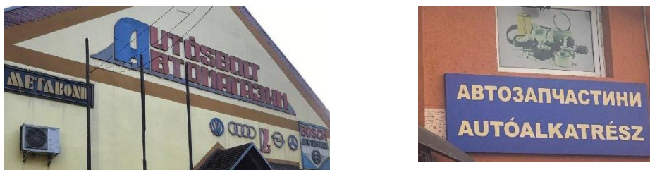
Фото 14–15. Українсько-угорські написи на магазинах автозапчастин у Берегові (зліва) та Великій Доброні (справа)

розташованих у румунських населених пунктах, теж здебільшого трапляються двомовні написи (див. Фото 16).