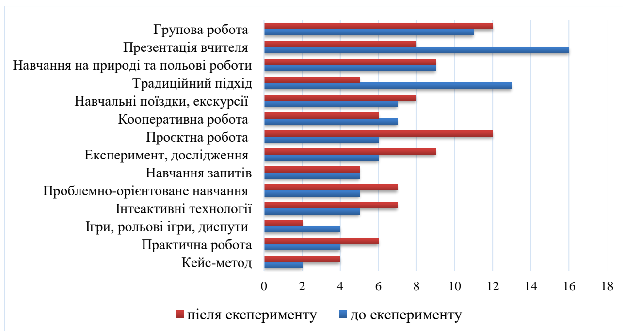
Рис. 1. Методи (у %), що найчастіше використовувались вчителями природничих дисциплін для формування екологічної грамотності та культури в учнів до та після експерименту