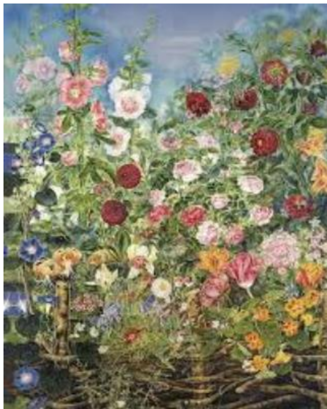
Рис. 2. К. Білокур. Квіти за тином. 1935 р.