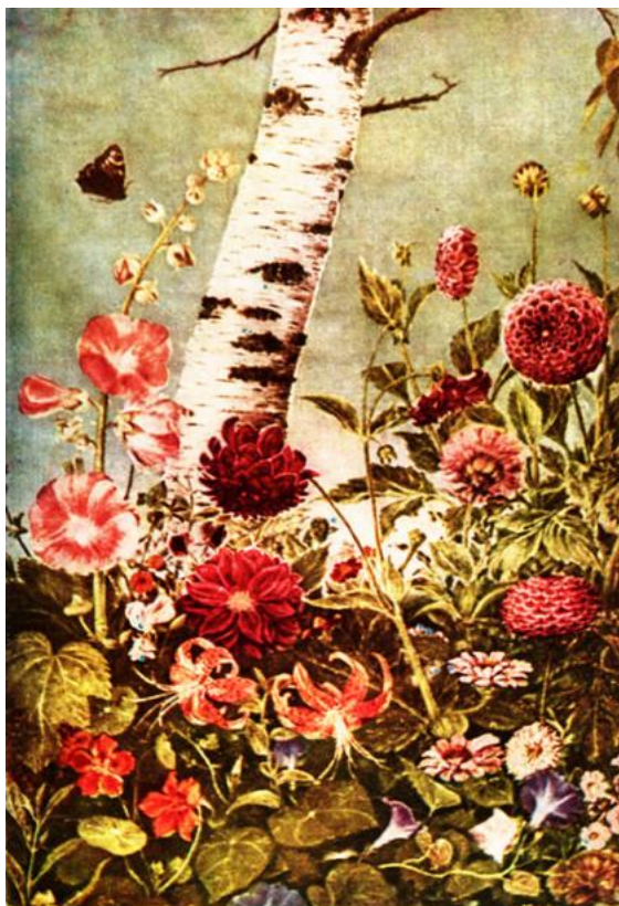
Рис. 1. К. Білокур. Берізка. 1934 р.