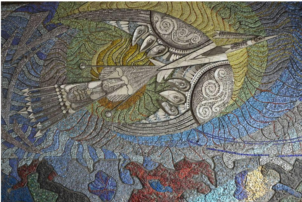
Рис. 2. Мозаїка «Боривітер», ресторан «Україна», м. Маріуполь, 1967 р.

Її роботи, такі як: «Шевченко. Мати», «Боривітер» (рис. 2), «Дерево життя» (рис. 3) та багато інших були сміливими експериментами, що протистояли канонам тоталітарного мистецтва. Їх визнавали ідейно ворожими та націоналістичним, тому забороняли та знищували. Водночас твори Алли Горської є символами свободи та боротьби за українську ідентичність.