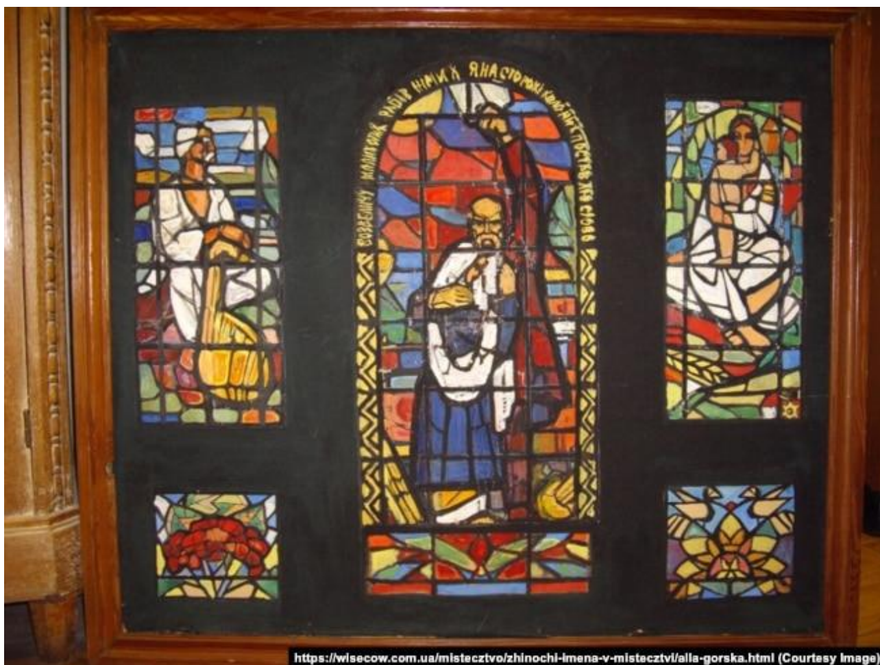
Рис. 1. Ескіз вітража «Шевченко. Мати» для Київського університету, 1964 р.

Неодноразово Аллу Горську викликали на допити та проводили «профілактичні бесіди» з погрозами та попередженнями. За вітраж у Київському університеті «Шевченко. Мати» (рис. 1) її було виключено зі Співки художників України. Її роботи забороняли показувати на виставках. Театральні постановки, у яких вона брала участь як художник, проходили жорстоку цензуру та заборонялись для показу. Горську намагались максимально ізолювати від суспільства та стерти її внесок в історію.