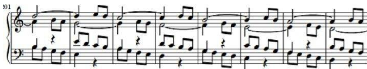
Рис. 5 На фото: уривок з першої частини твору «Хроматична спроба». Приклад чотириголосся

У першій частині темп змінюється на швидкий (Vivo). Часто звучать секвенції, що додають об'єму та багатогранності. Фактура першої частини нагадує жанр прелюдії, виклад чотириголосний (див. рис. 5).