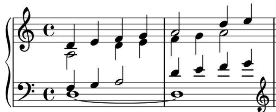
Рис. 3 На фото: рух голосів вгору. Початок вступу твору «Хроматична спроба»

У вступі присутня хоральність, що нагадує спів хору в церкві. Він звучить велично. Виклад чотириголосний. Темп не швидкий. Гармонія дисонансна, переважно рухається за малими секундами. Динаміка одноманітна. Рух голосів вгору зустрічається два рази: на самому початку твору (див. рис 3) та в середині вступу (див. рис. 4). Модуляції немає, але трапляється VII підвищений ступінь, що утворює гармонічний лад. Закінчується вступ ре мінорним секстакордом з подвоєною тонікою.