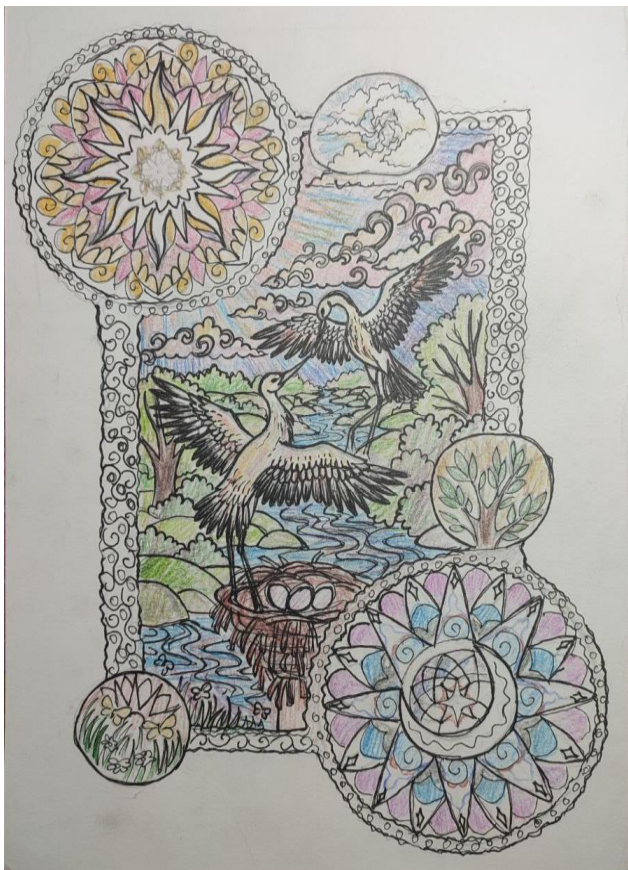
Рис. 1. Ескіз авторської декоративної композиції «Лелече гніздо».

мистецтва, а саме пірографії, дот-арту, пап'є-маше та інкрустації. Вибір такого мультимодального підходу зумовлений прагненням створити складну художню фактуру, де графічна чіткість випалювання гармоніює з об'ємною пластикою та ритмічним кольоровим декором.