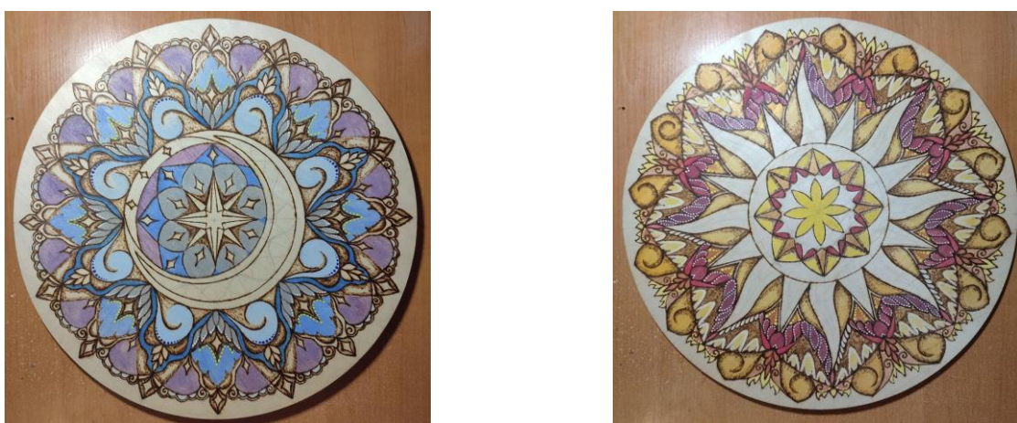
Рис. 4. Точковий розпис мандал за допомогою дотсів (дот-арт).

Для створення рельєфних акцентів і складних об'ємних форм, що виходять за межі площини основи, у проєкт інтегрована техніка пап'є-маше. Висока адгезія паперової маси до дерев'яних поверхонь дозволяє органічно поєднувати ці матеріали.