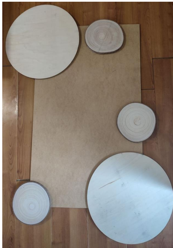
Рис. 2. Композиційна структура творчої роботи «Лелече гніздо».

Використання пірографії (художнього випалювання) під час виконання творчої роботи обґрунтоване її здатністю створювати стійкі лінійно-графічні зображення на органічних субстратах (деревині, фанері) (рис. 3). Технологічний процес базується на термічній трансформації поверхні матеріалу під впливом розігрітого ніхромового пера електровипалювача.