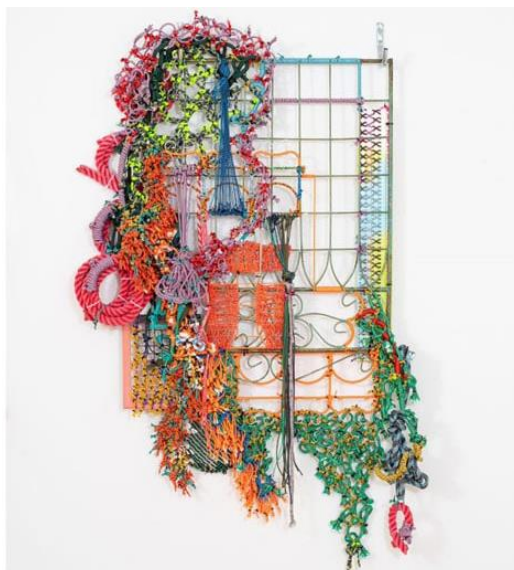
Рис. 2. Текстильний асамбляж на металевій основі (змішана техніка).

Серед змішаних технік важливе місце займає асамбляж — художній прийом, що передбачає створення композиції з різнорідних матеріалів і готових об'єктів. У текстильному мистецтві асамбляж проявляється у поєднанні тканин, ниток, мережива, друкованих зображень та інших елементів. Такий підхід дозволяє створювати складні багат шарові композиції, що мають як декоративну, так і концептуальну функцію.