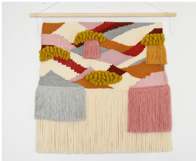
Рис. 1. Сучасний об'ємний гобелен (експериментальне ткацтво).

Важливим напрямом розвитку змішаних технік є поєднання різноманітних матеріалів. Сучасні митці активно вводять у свої твори метал, пластик, деревину, скло та інші нетекстильні елементи. Таке поєднання дозволяє створювати нові фактурні та візуальні ефекти, розширюючи можливості текстильного мистецтва. Особливо цікавим є використання металевих конструкцій або сіток як основи для текстильних композицій, що поєднують у собі елементи вишивки, плетіння та колажу.