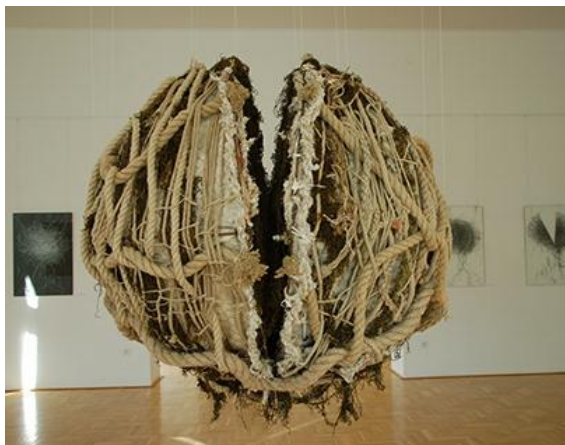
Рис. 3. Текстильна інсталяція з вторинних матеріалів (upcycling).

Колористика композицій та арт-об'єктів виконаних у змішаних текстильних техніках також зазнає змін. Поєднання різних матеріалів і текстур створює складні кольорові взаємодії, які не завжди можна досягти завдяки використанню традиційних технік. Вкраплення ниток різного походження, фарбованих тканин, а також введення нетекстильних елементів сприяє виникненню нових візуальних ефектів. Важливу роль відіграє світло, яке по-різному взаємодіє з різними поверхнями, підсилюючи декоративні та просторові характеристики твору.