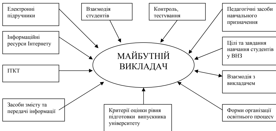
Рис. 1. Узагальнена модель формування в майбутніх педагогів умінь роботи з навчальною іншомовною літературою засобами комп'ютерних технологій

За своїм місцем у процесі пізнання педагогічна модель характеризується як засіб організації дослідження, яке в різних формах присутнє на всіх етапах пізнавального процесу. Моделювання, виступає як спосіб багатогранного розкриття причин педагогічних явищ, що дозволяє виявляти закономірності різних сторін застосування комп'ютерної технології у процесі формування вмінь роботи з іншомовною літературою.