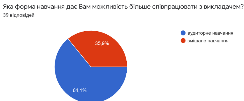
Рис. 5. Запитання: Яка форма навчання дає Вам більше співпрацювати з викладачем?

І останнє запитання: «Яка форма навчання дає Вам можливість більше співпрацювати з викладачем?» (рис. 5). На нашу думку, результати відповідей саме такі через те, що ані студенти, ані викладачі ще повністю не відійшли від традиційної аудиторної системи навчання, вони ще не усвідомили всіх переваг у роботі онлайн.