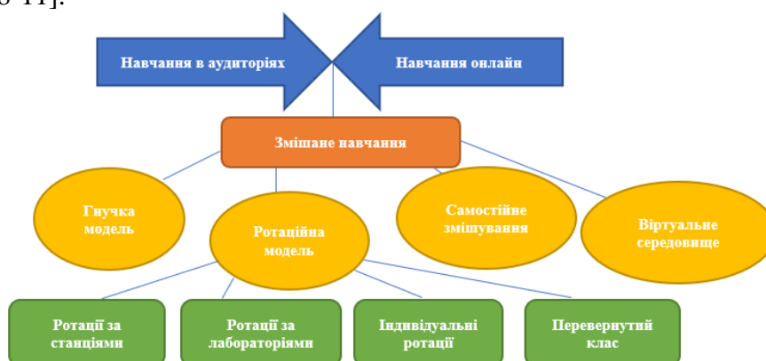
Рис. 1. Модель змішаного навчання

Існує декілька варіантів реалізації змішаного навчання. Для детальнішого розуміння процесу змішаного навчання, ми обрали класифікацію Майкла Хорна та Гізера Стейкера (рис.1) [6, с. 8-11].