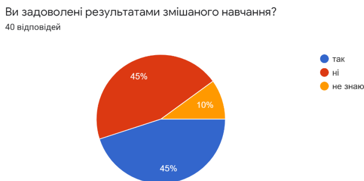
Рис. 4. Запитання: Ви задоволені результатами змішаного навчання?

Запитання: «Вам подобається змішаний тип навчання?» (рис. 3). Половині респондентів подобається така форма навчання, але водночас досить великий відсоток не задоволений. Тому, можна зробити висновки, що студенти недостатньо проінформовані, зацікавлені та вмотивовані.