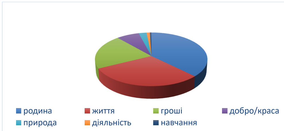
Рис. 1. Діаграма ціннісних орієнтацій молодших школярів

У процесі експериментального дослідження нами була проведена бесіда з молодшими школярами, мета якої полягала у тому, щоб визначити рівень розуміння дітьми поняття цінність. Результати дають змогу стверджувати, що молодші школярі у поняття цінності вкладають різний зміст (рис. 1.).