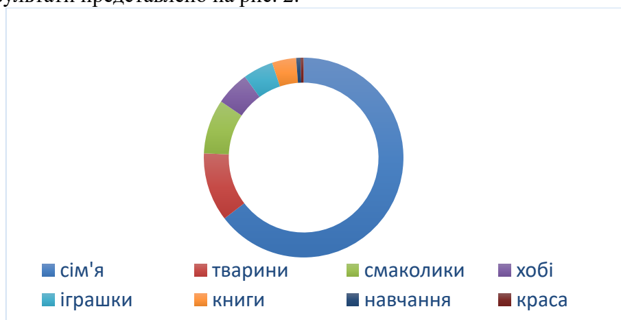
Рис. 2. Діаграма особистісних уподобань молодших школярів

Для того, щоб об'єктивно визначити рівень сформованості ціннісних орієнтацій дітей нами було запропоновано завдання, яке полягало в тому, щоб закінчити речення: «Я найбільше за все люблю...». Схвально, що для значної частини дітей сім'я є пріоритетною цінністю. Результати представлено на рис. 2.